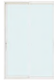
ประตูบานเลื่อนคู่ (สลัก)