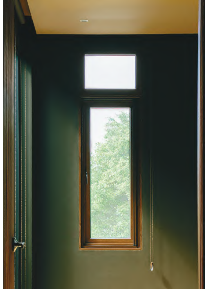
ឥដ្ឋឈើ (Dark Walnut)