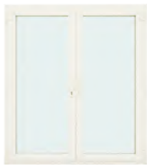
ประตูบานเปิดคู่