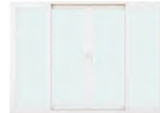
หน้าต่างบานเลื่อนสี่บาน