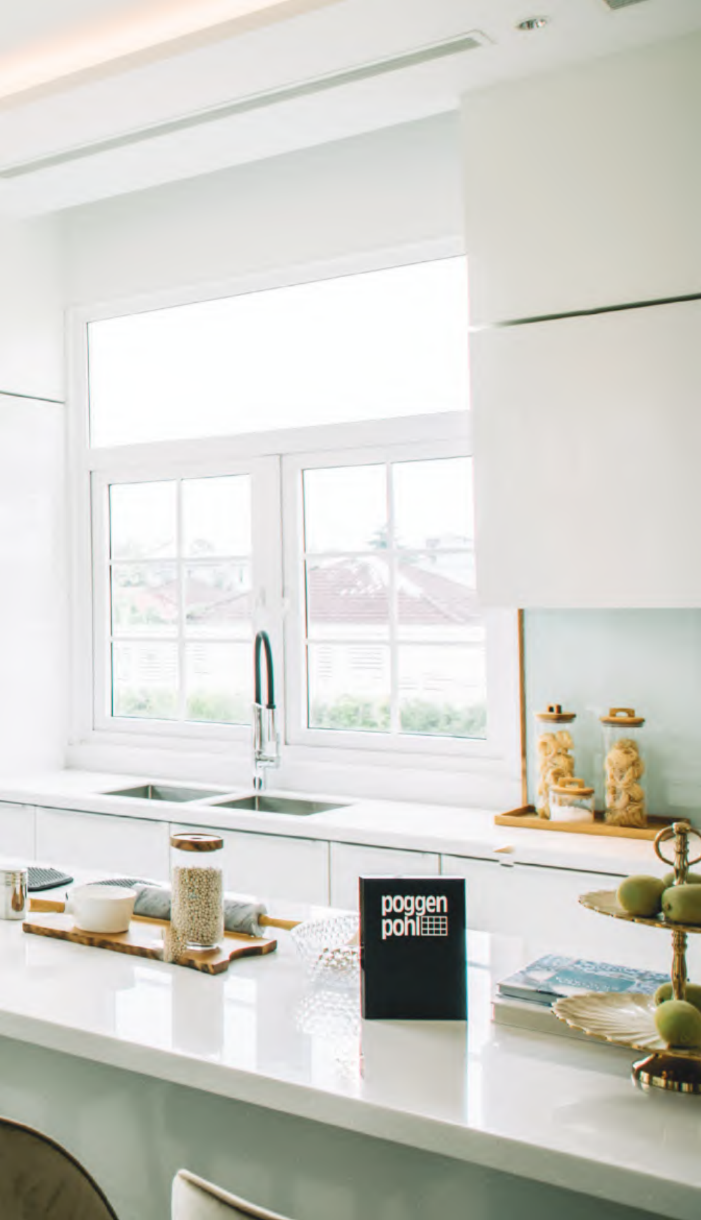
สีขาว (Glorious White)