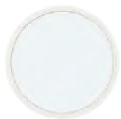
ช่องแสงวงกลม