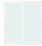
หน้าต่างบานเลื่อนคู่ (สลับ)