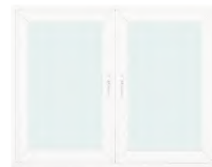
หน้าต่างบานเปิดคู่