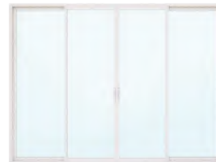
ประตูบานเลื่อนสี่บาน