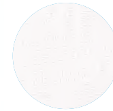
รุ่มมาตรฐาน