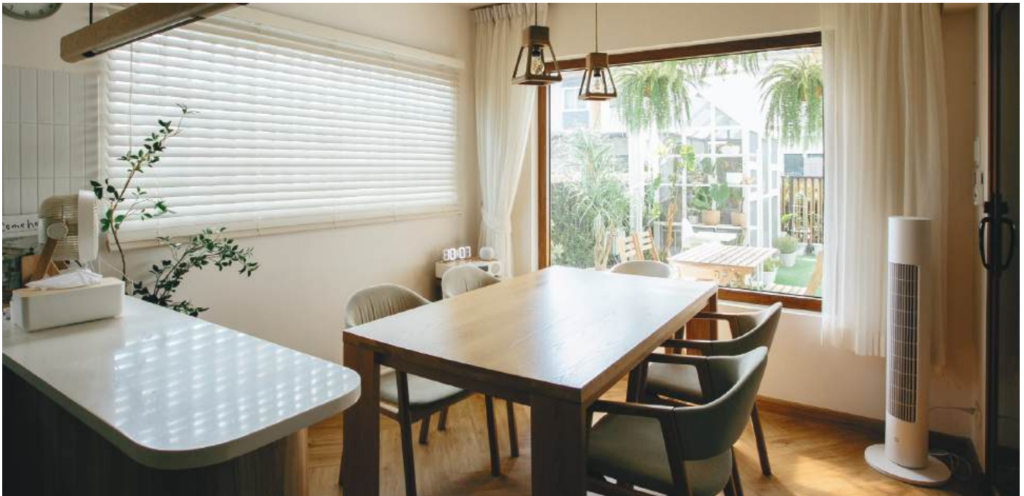
สีทึบ (Amber Teak)