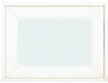
หน้าต่างบานกระทุ้ง