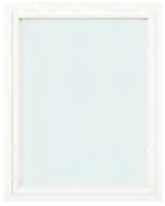
หน้าต่างบานช่องแสง