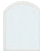
ช่องแสงโค้ง